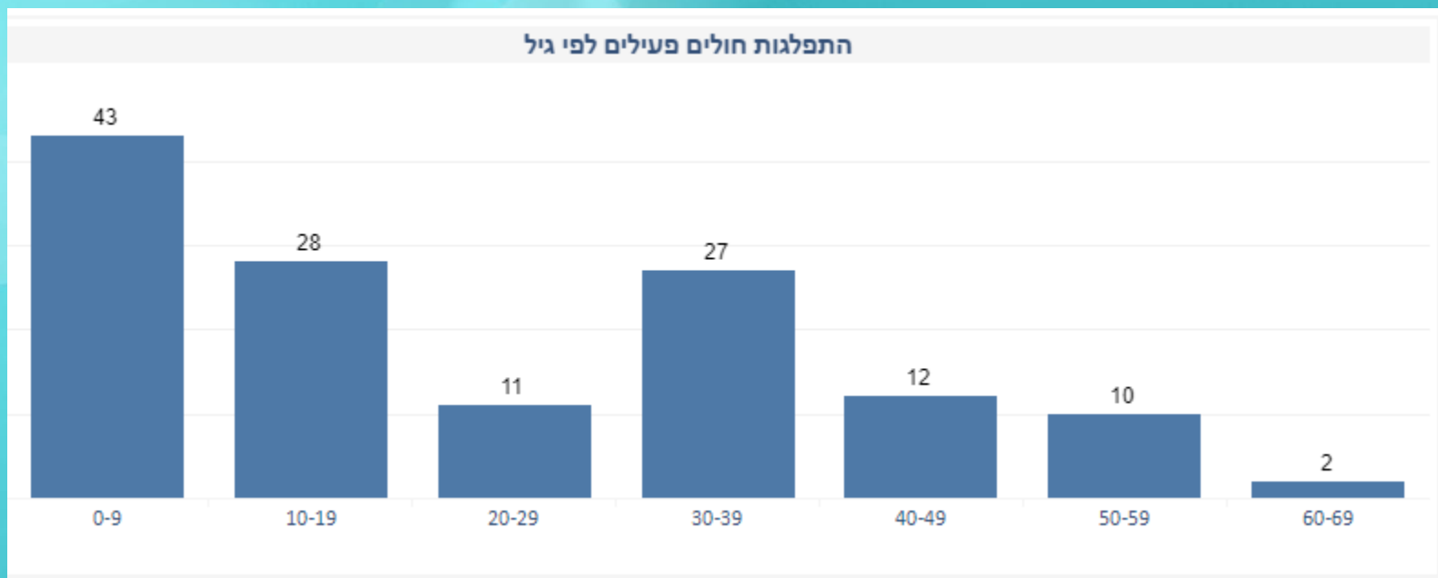
התפלגות חולים פעילים לפי גיל