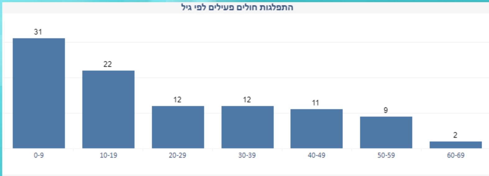
התפלגות חולים פעילים לפי גיל